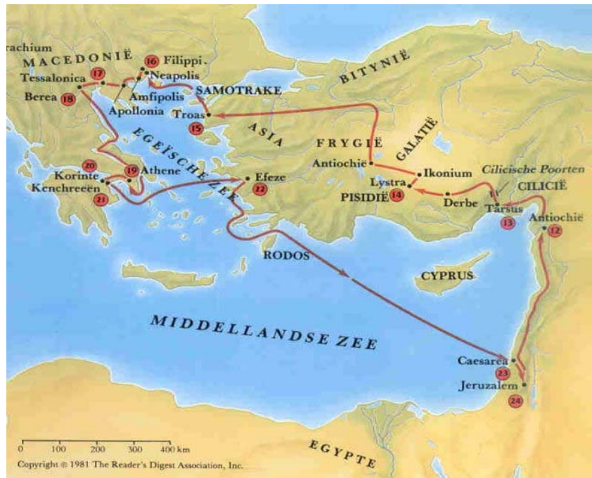
Tweede zendingsreis van Paulus

In de vorige bijeenkomst hebben jullie nagedacht over verschillende aspecten van zendingswerk. Paulus stichtte tientallen gemeenten. De christelijke gemeente van Rome is waarschijnlijk ontstaan uit het getuigenis van mensen die op de pinksterdag tot geloof gekomen zijn. Naast gemeentestichting is een tweede onderdeel van zending, Bijbelvertaalwerk. Gods Woord moet in elke taal verspreid worden.