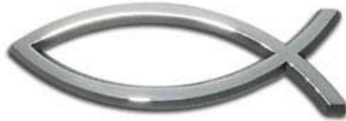
De Ichthus: Jezus Christus, Zoon van God, Verlosser