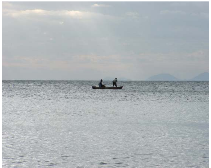
Ik zal u vissers van mensen maken

'Maar wat moet ik nu met zending?' zo vraag je jezelf wellicht af. 'Moet ik dan ook zendeling worden?' Vragen die je niet zomaar naast je neer moet leggen in de zin van: 'Zending? Niks voor mij!' Je maakt immers deel uit van een gemeente en kerk die door Jezus Christus zelf geroepen is om het Evangelie van het Koninkrijk in de gehele wereld te verkondigen. Die 'gehele wereld' is China, Wit Rusland, Kenia, Malawi, maar ook België, Nederland, Amsterdam, jouw stad of dorp, je buurman.