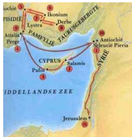
Eerste zendingsreis van Paulus

Met de uitzendingsdienst van Paulus en Barnabas in Handelingen 13:1-4 begint een nieuwe fase in het zendingswerk van de vroegchristelijke kerk. Als echte zendelingen trekken zij er op uit naar het buitenland (Klein-Azië, Griekenland en Paulus had zelfs het plan om naar Spanje te gaan! Romeinen 15:24, 28).