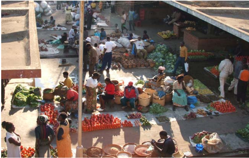
De kleurrijke markt in Malawi